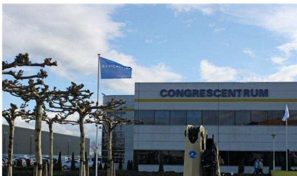
De vlag van USG Energy wappert voor de Evenementenhal in Gorinchem tijdens de On- en Offshore vakbeurs.

In de Evenementenhal in Gorinchem werd 30 maart, 31 maart en 1 april de On- & Offshore vakbeurs gehouden. Deze beurs kenmerkt zich als een beurs voor onder andere toeleveranciers, constructeurs en groothandelaren actief in de olie- en gasindustrie en (petro)chemie. Ook USG Energy was deze drie dagen met een stand vertegenwoordigd. Door de brede vertegenwoordiging in de olie- en gasindustrie, werd de stand van USG Energy door vele relaties en geïnteresseerden bezocht.